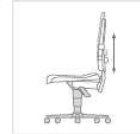
In hoogte verstelbare rugleuning