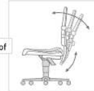
Synchroontechniek met gewichtsregeling